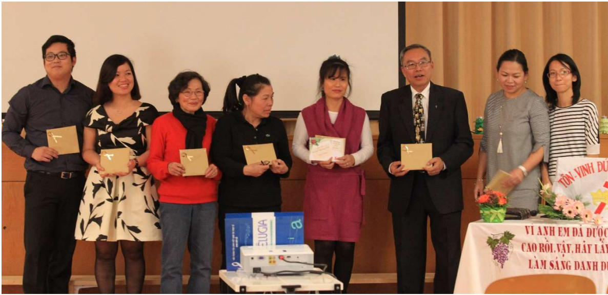
Trao giải thưởng đồ Kinh Thánh chi hội Lausanne và Genève